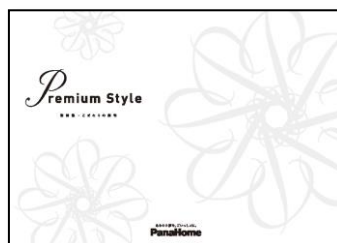
⑦ こだわりの邸宅 「Premium Style」 実例集