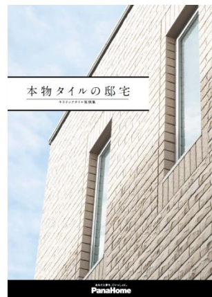
⑧ 本物タイルの邸宅 キラテックタイル実例集