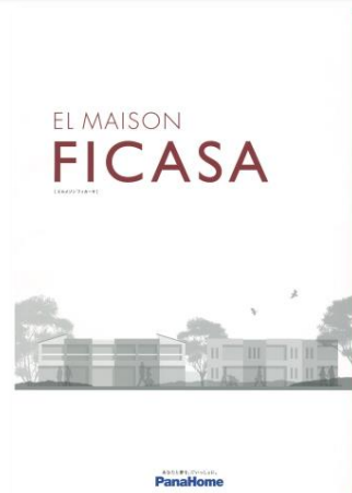
④ 先進の賃貸住宅 「フィカーサ」