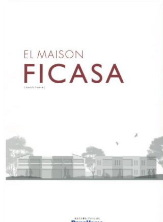
④ 先進の賃貸住宅 「フィカーサ」