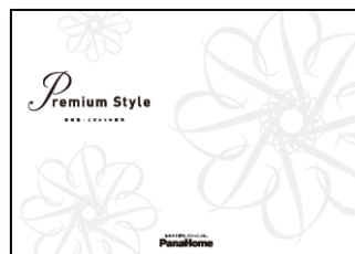
⑦ こだわりの邸宅 「Premium Style」 実例集