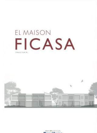
④ 先進の賃貸住宅 「フィカーサ」