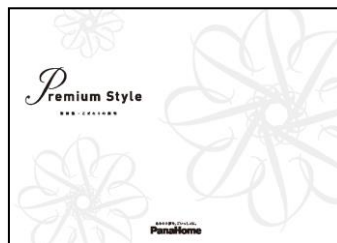
⑦ こだわりの邸宅 「Premium Style」 実例集