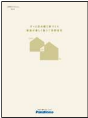
⑤ 二世帯住宅「つどいえ」 実例集