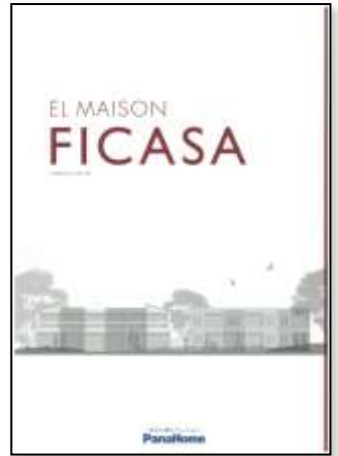
④ 先進の賃貸住宅 「フィカーサ」