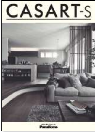
② 暮らし心地を自由にデザイン する制震鉄骨の家 「カサート-S」