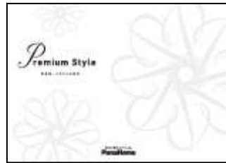
⑦ こだわりの邸宅 「Premium Style」 実例集