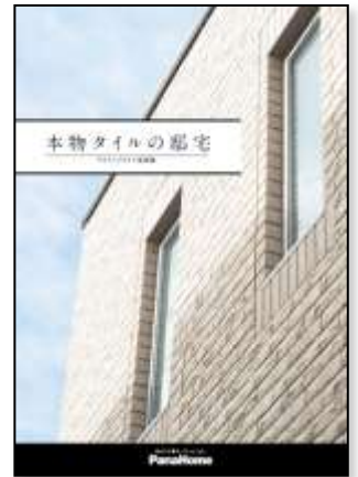
⑧ 本物タイルの邸宅 キラテックタイル実例集