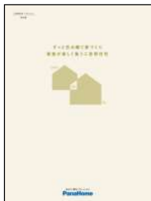
⑤ 二世帯住宅「つどいえ」 実例集