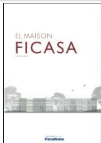
④ 先進の賃貸住宅 「フィカーサ」