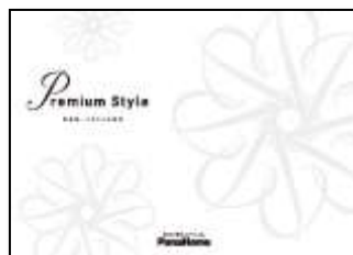
⑦ こだわりの邸宅 「Premium Style」 実例集