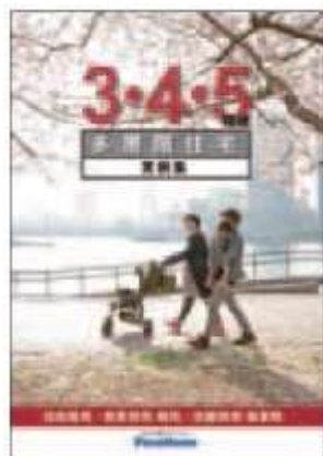
⑥⑥ 「3・4・5階建多層階住宅」 実例集