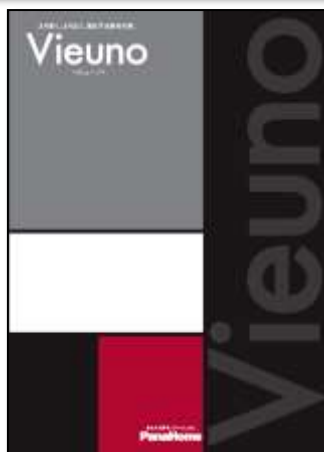
③ より高く、より広く。 進化する重量鉄骨の家 「ビューノ」