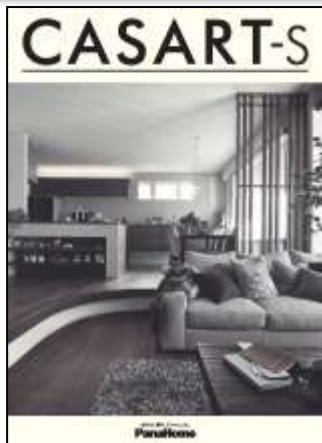
② 暮らし心地を自由にデザイン する制震鉄骨の家 「カサート-S」