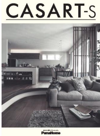
② 暮らし心地を自由にデザイン する制震鉄骨の家 「カサート-S」