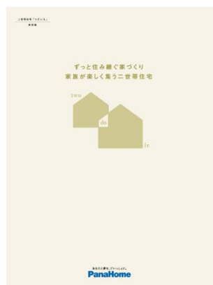
⑤ 二世帯住宅「つどいえ」 実例集