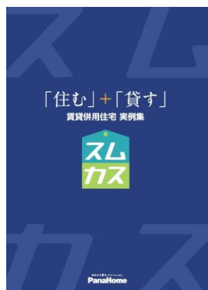
⑥ 賃貸併用住宅「スムカス」 実例集