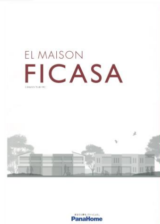
④ 先進の賃貸住宅 「フィカーサ」