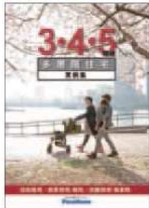
⑥ 「3・4・5階建多層階住宅」 実例集