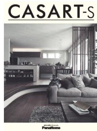
④ 暮らし心地を自由に デザインする制震鉄骨の家 「カサート-S」