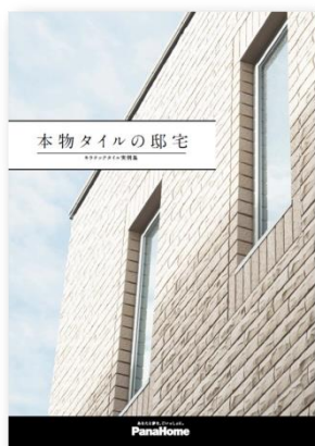
⑤ きれいが続く邸宅 「本物のタイル邸宅」 実例集