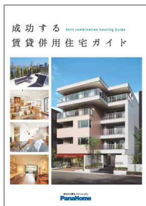
⑥ 成功する 『賃貸併用住宅ガイド』