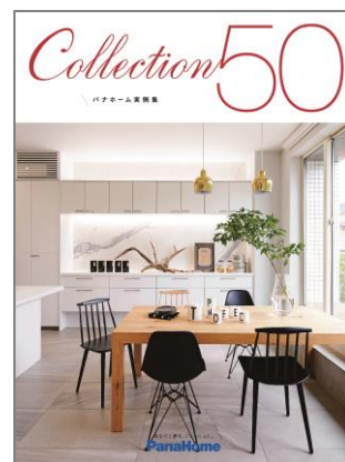
⑧ 実例集 『コレクション50』