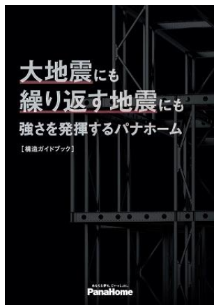
② 繰り返す地震に強い 「構造ガイドブック」