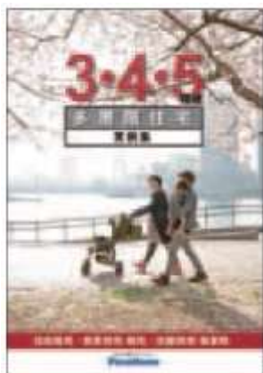
⑥ 「3・4・5階建多層階住宅」 実例集