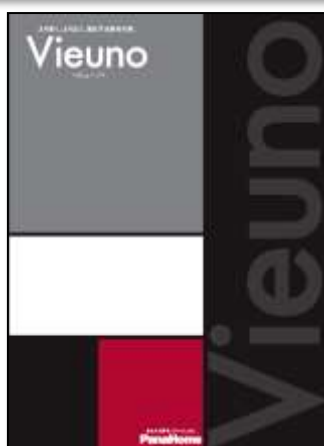
③ より高く、より広く。 進化する重量鉄骨の家 「ビューノ」