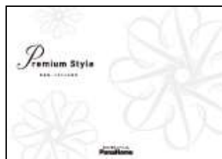
⑦ こだわりの邸宅 「Premium Style」 実例集