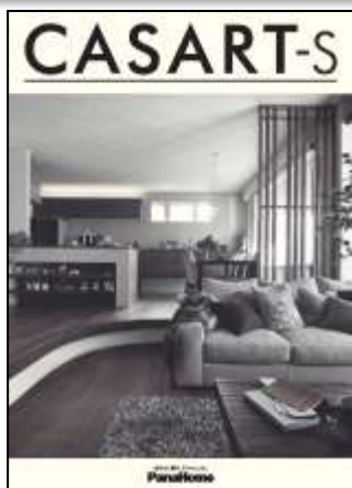
② 暮らし心地を自由にデザイン する制震鉄骨の家 「カサート-S」