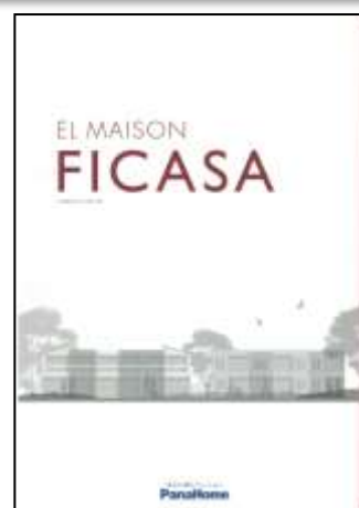
④ 先進の賃貸住宅 「フィカーサ」