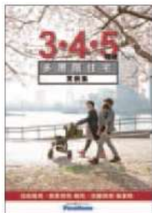
⑥ 「3・4・5階建多層階住宅」 実例集