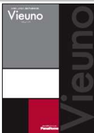
③ より高く、より広く。 進化する重量鉄骨の家 「ビューノ」