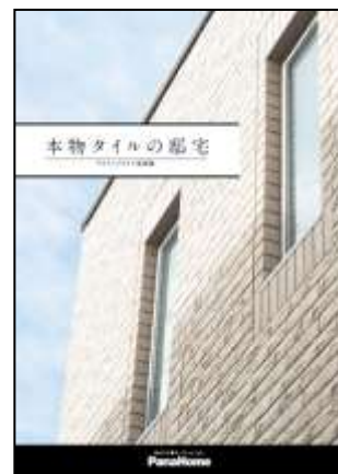
⑧ 本物タイルの邸宅 キラテックタイル実例集