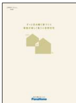
⑤ 二世帯住宅「つどいえ」 実例集