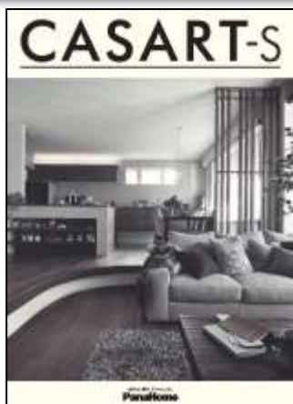
② 暮らし心地を自由にデザイン する制震鉄骨の家 「カサート-S」