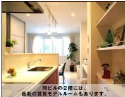
同ビルの2階には、最新の賃貸モデルルームもあります。

後援 住宅生産振興財団 昭和54年に住宅の質、住環境の質の向上に取り組みことを目的に設立された一般財団法人です。 実績:全国421か所、18,441棟の戸建住宅を供給(平成25年度末実績) 東京都が推進している木密地域不燃化10年プロジェクトに協力しています。