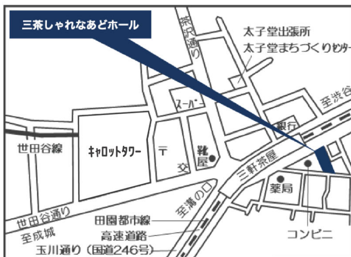
三茶しゃれなあどホール (世田谷区三軒茶屋1-41-10)