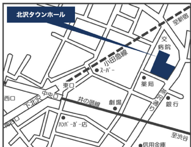
北沢タウンホール (世田谷区北沢2-8-18)